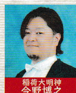
稲荷大明神 今野博之