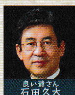
良い爺さん 石田 久大

灰を持ち帰った善良なじいさんが風で灰をまくと、枯れ木に花が咲いた。通りかかった殿様は喜び、褒美を取らせた。真似した欲張りじいさんは花を咲かせられず、殿様の怒りをかった。しかし殿様はハッピーエンドを望み、善良なじいさんに願いを聞いた。じいさんの願いは「ポチが生き返ること」だった。